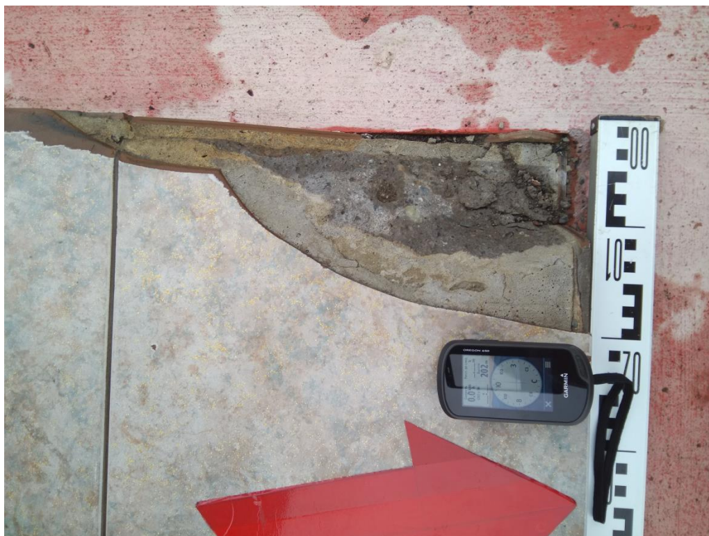
Рис. 3. Чукотский автономный округ. Город Анадырь. Памятник регионального значения «Памятник В.И. Ленину». Дефект основания в виде скола на всю глубину плиты (облицовочная плитка и бетонное основание) в северо-западном углу постамента.