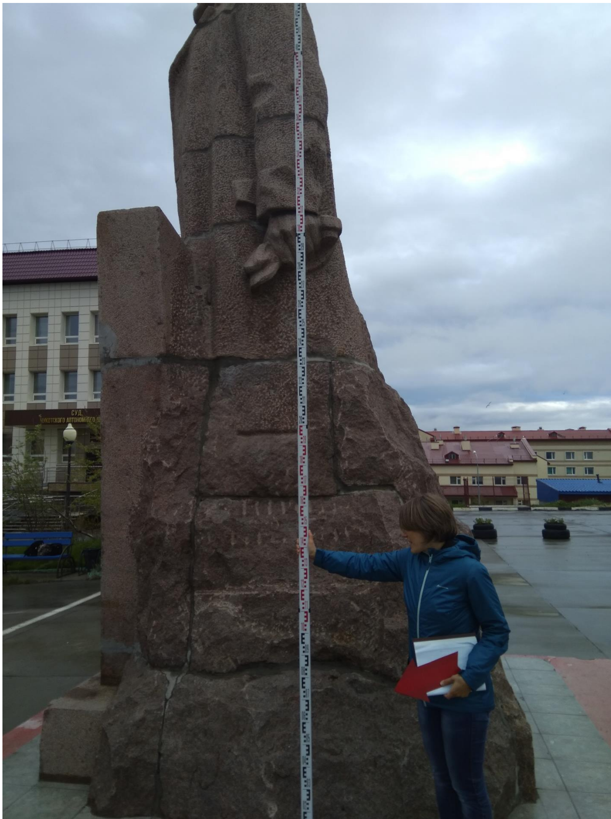
Рис. 2. Чукотский автономный округ. Город Анадырь. Памятник регионального значения «Памятник В.И. Ленину». Вид сбоку на основание в виде необработанного гранита.

Фото от 26.06.2017 г. Вид с запада-юго-запада. На фото видны места соединения гранитных отдельных блоков.