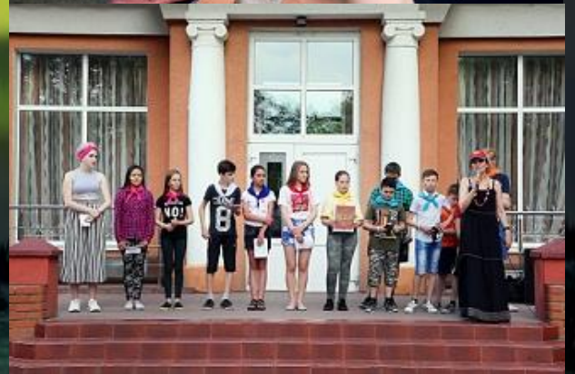
Республика Татарстан г.Казань ДОЛ «Байтик» В детском оздоровительном лагере «Байтик» отдохнули 40 детей из г.о.Анадырь и п.Угольные Копи.